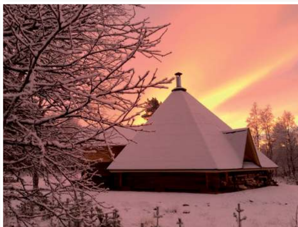
50 vieraan ryhmä mahtuu syyskuussa valmistuneeseen Tievakotaan, jonka halkaisija on 10 metriä ja korkeus 6 metriä.

Vuoden aikana saatiin pitkään venyneet rakennuslupa-asiat kuntoon ja näin nuorten ja lasten ryhmien käyttöön valmistui elokuussa Kotatieva. Rantasauvan lauteet uusittiin ja Purotievan WC ja pesutilan lattiat laatoitettiin.