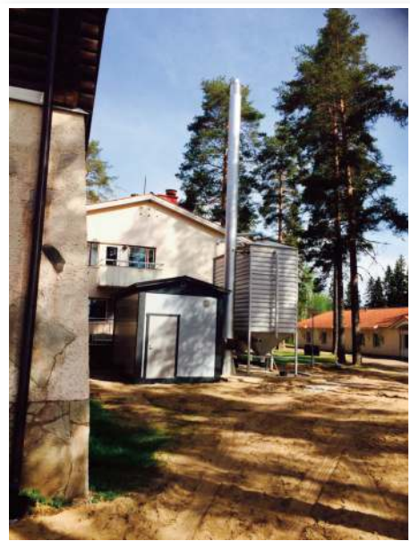
Partaharjulla otettiin käyttöön pellettilämmitysjärjestelmä, joka on myöhemmin maisemoitu ympäristöön.

Syksyllä varmistui myös Veej'jakaja ry:n myöntämä rahoitus tilauskodalle. Kodan rakentaminen aloitetaan keväällä 2017. Kota tulee palvelemaan luontopolkujen ja Partaharjun toimintakeskuksen asiakkaita sekä tarjoaa miellyttävän taukopaikan Pieksämäen kaupungin asukkaiden virkistyskäyttöön.