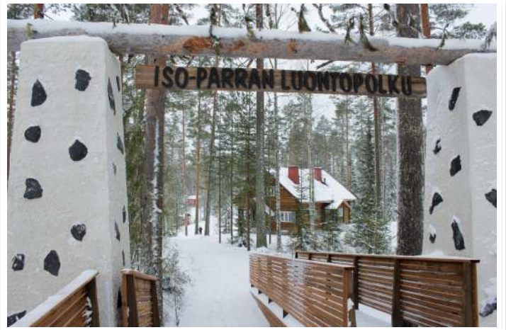
Syksyllä valmistui Iso-Parran luontopolun portti ja lähes koko luontopolku valmiiksi.

Kuluneen vuoden aikana rakennettiin ja perusparannettiin yhteistyössä Pieksämäen kaupungin ja Seurakuntaopiston opiskelijoiden kanssa Partaharjun luontoreitistöjä. Keväällä vihittiin käyttöön Pieni pyhiinvaellus -polku ja loppusyksystä valmistui n. 1,5 kilometriä pitkä esteetön luontopolku, joka nimettiin edesmenneen leirikylän perustajan opetusneuvos Pentti Tapion lempinimen mukaisesti Iso-Parran luontopoluksi. Reitistö rakentaminen palkittiin Kirkkohallituksen myöntämällä vuoden 2016 ympäristökasvatuspalkinnolla. Myös tilausaanun ja ulkoterassien esteettömyyttä parannettiin luiska- ja porraskorjauksilla.