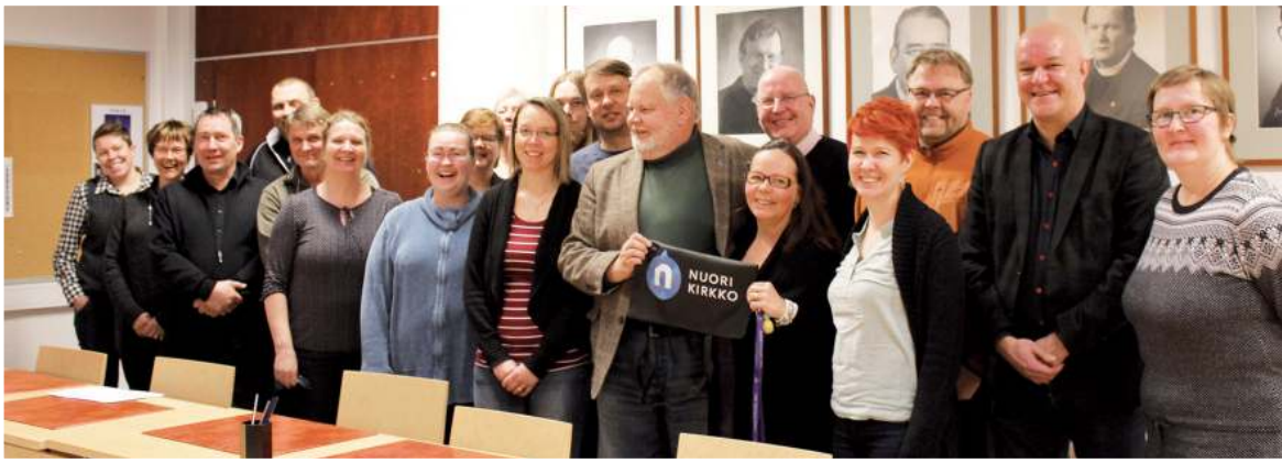
PTK:n valtuuston kokous syksyllä 2016 oli historiansa viimeinen, jos fuusion toteutuu.

Liittokokouksen valitseman valtuuston kokoonpano toimikautena 1.9.2015–31.8.2019: