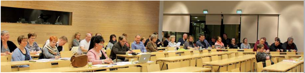
Ylimääräinen liittokokous 18.4.2016 hyväksyi esityksen yhdistymisestä NK:n ja SLK:n kanssa ja teki ensimmäisen päätöksen PTK:n purkautumisesta.