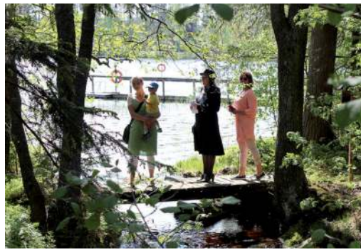
Pieni pyhiinvaellus -polku otettiin käyttöön keväällä 2016.

Pieksämäellä sijaitseva Partaharjun toimintakeskus tarjoaa leiri-, kurssi- ja juhlapalveluja luonnonkauniissa ympäristössä keskellä Järvi-Suomea.