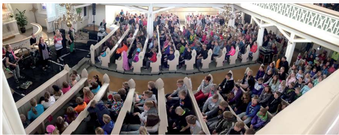
Alahärmän kirkko täyttyi ääriään myöten kevätretkeläisistä.